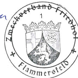
Klaus Wiesemann Verbandsvorsteher